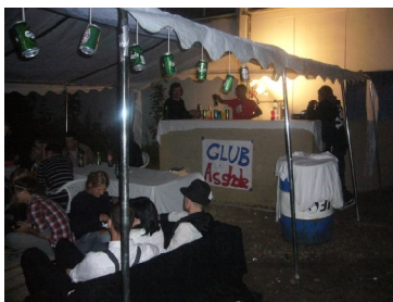
Ycity 2009 på Musiccon

Ycity '10 er en videreførelse af ungdomsdemokratiprojekterne, Ycity 2008 og 2009. Disse projekter gik ud at skabe to midlertidige byer i henholdsvis Nykøbing Falster og Roskilde beboet af unge fra Danmark, Sverige og Tyskland, hvor man kunne skabe sine egne actions og projekter i fællesskab med andre. Idéen var at skabe et action-fællesskab på tværs af grænser og skabe rum for nye former for demokrati og politisk deltagelse. Ycity-projekterne skal udbrede en demokrati-forståelse, hvor det er én selv, der skaber samfundsforandring, men i fællesskab med andre – en lokal forandring i en global kontekst.