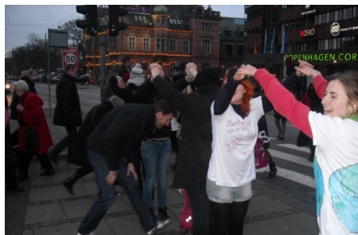
Bro Bro Brille i fodgængerovergang